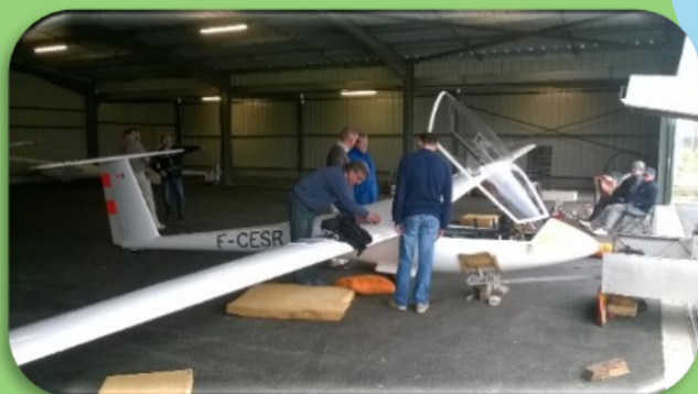
Début de stage avec le montage des planeurs

Tous ces efforts communs nous permettent de débiter notre premier stage le samedi 15 avril, conformément aux prévisions, mais avec un hangar inachevé (les portes ne ferment pas...). Le club-house n'est pas encore réceptionné, mais peu importe, car ce qui compte ce sont les planeurs, qui sont désormais à l'abri. Et puis, pour les vélivoles, faire quelque peu du camping, ce n'est pas rédhibitoire !